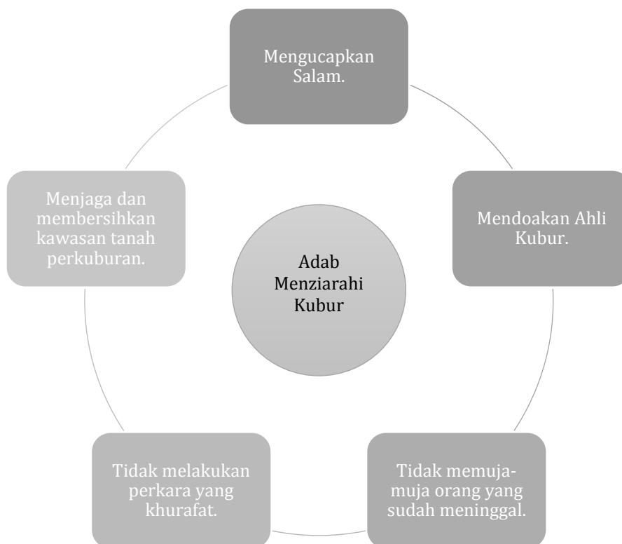
Rajah 1 : Adab-adab menziarahi kubur atau maqam